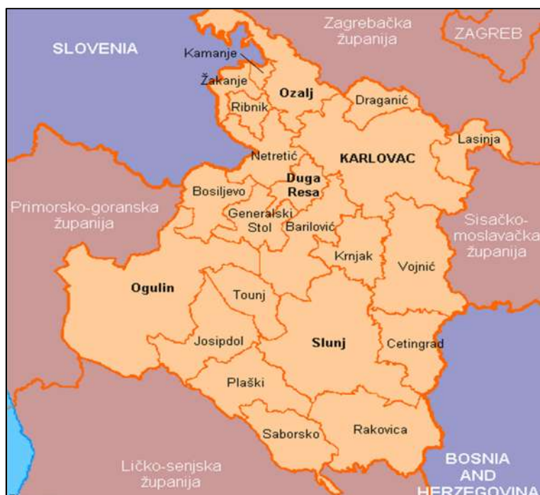
Slika 1. Administrativne granice Općine Generalski Stol unutar Karlovačke županije ( www.mup.hr )

različitosti prirodnih osobitosti alpskog, panonskog i kraškog ozemlja. Ljepote karlovačkih rijeka Kupe, Korane, Mrežnice i Dobre, šumovitost gorja Velike i Male Kapele, zelenilo kordunskog krša, tranzitni položaj i bogata povijesna baština trajne su vrijednosti na kojima počiva gospodarsko privređivanje i kvaliteta življenja njena stanovništva.