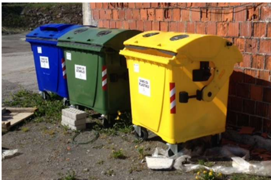
Slika 2: Prikaz zelenog otoka

Posude i kontejneri za miješani komunalni otpad zapremine 120, 240, 1100 lit i 5m 3 smješteni su uglavnom unutar objekata i drugih prostora za tu namjenu, tamo gdje to nije moguće na javnim površinama, što se prvenstveno odnosi na posude i kontejnere veće zapremine (1100 lit i 5m 3 ).