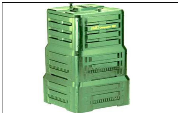
Slika 4: Posude za primarnu selekciju komunalnog otpada, komposter za kućanstvo